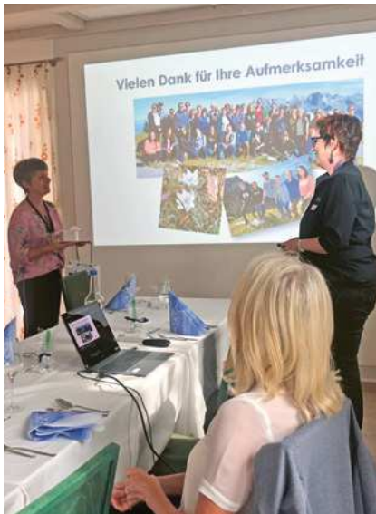
Lunch & Learn 2 Sargans, 24. September 2020