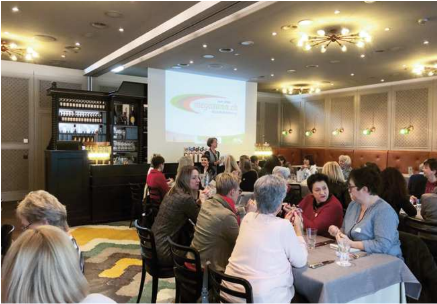
Lunch &amp; Learn 1 in St.Gallen