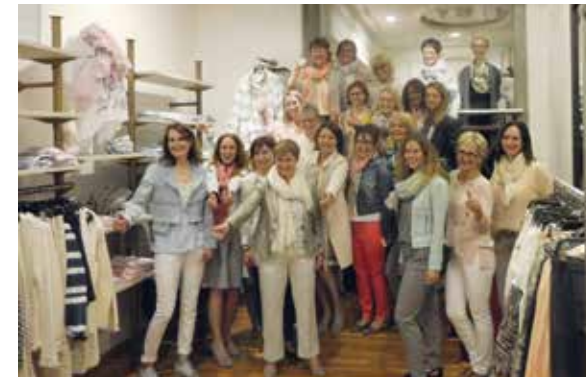
More Women St. Gallen