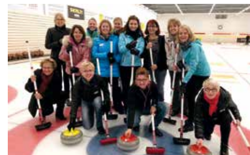
Curling St. Gallen