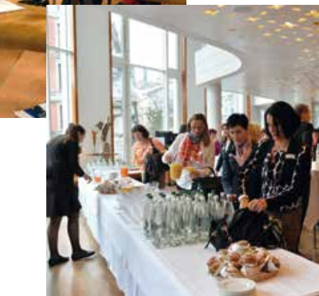
Impressionen kmu frauen Forum