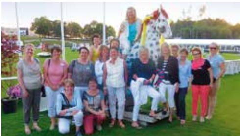
CSIO St. Gallen