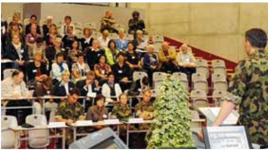
Waffenplatz St. Luzisteig