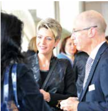
Referentin Karin Keller-Suter